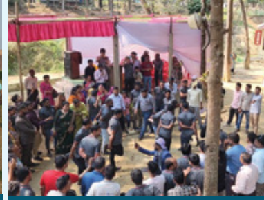
চট্টগ্রাম সাউথ রিজিয়ন