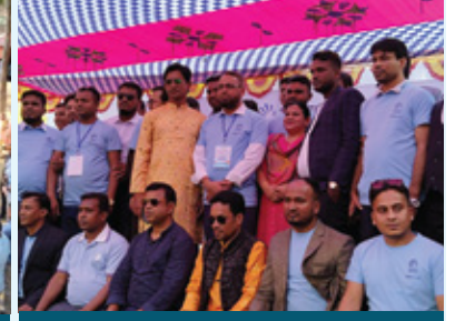
ঢাকা নর্থ রিজিয়ন