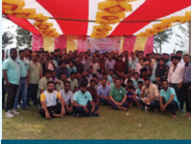
কুমিল্লা তিতাস রিজিয়ন