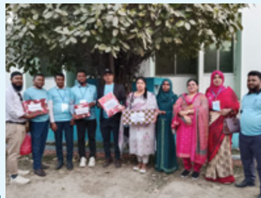
ঢাকা সাউথ রিজিয়ন