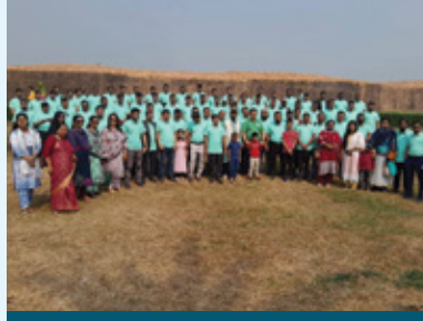
কুমিল্লা চৌদ্দগ্রাম রিজিয়ন