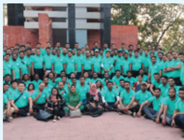
চট্টগ্রাম নর্থ রিজিয়ন